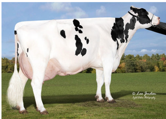
AURORA DOORSOPEN 17054 FIFTH DAM